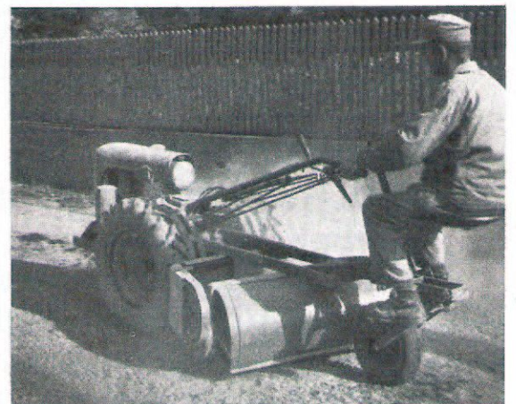
Mit der Kehrvorrichtung bei der Straßen-Reinigung