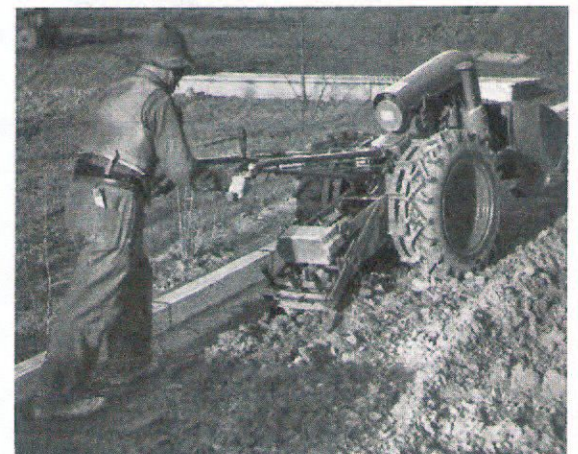
Mit dem Aufreißer beim Wegebau