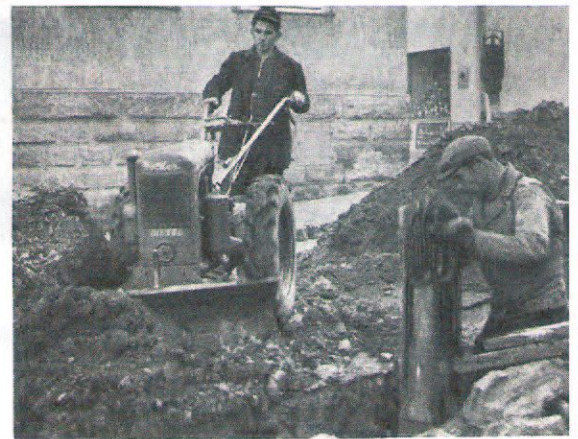
Mit Planierschild beim Zuschieben von Gräben